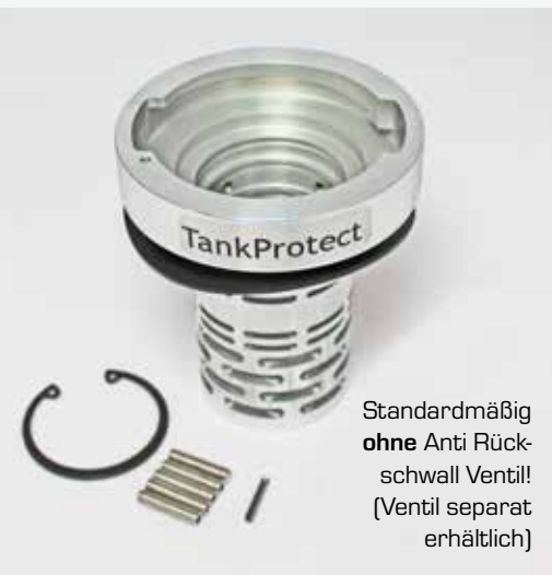
Standardmäßig ohne Anti Rück- schwall Ventil! (Ventil separat erhältlich)