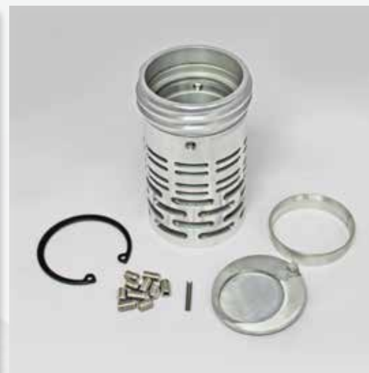
TankProtect für Scania, ohne Kragen, Art. Nr. S153.230