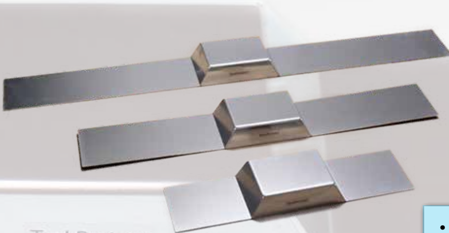
TankProtect Tankgeberschutz, feste Längen (kurz/mittel/lang), für alle Fzg.