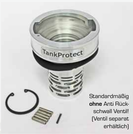
Standardmäßig ohne Anti Rück- schwall Ventil! (Ventil separat erhältlich)