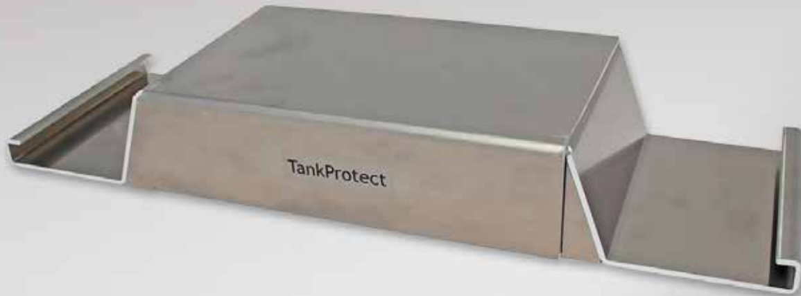
TankProtect Tankgeberschutz, einstellbar, für alle Fzg.